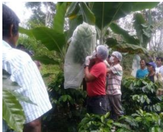
Banano y plátano (San Luis de Shuaro)