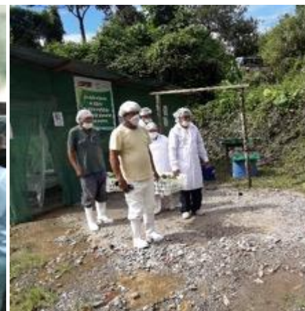
Vitoc y San Luis de Shuaro