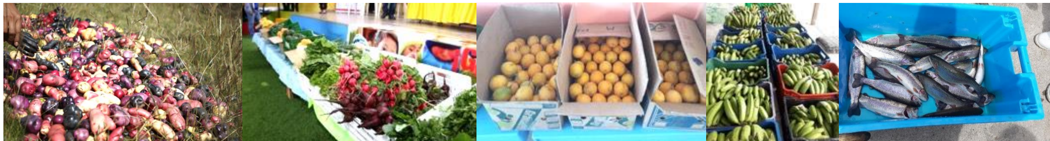
Compra de alimentos provenientes de la agricultura familiar: variabilidad de hortalizas y frutas propias de la zona.