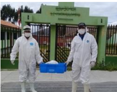
Asociación de Productores de Matahulo (Mito, Concepción)