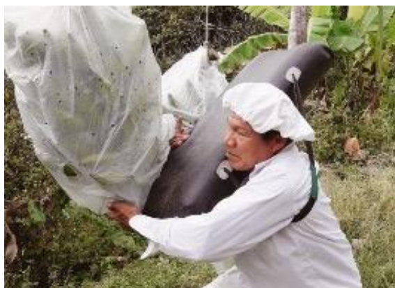
Banano y plátano (Vitoc, Chanchamayo)