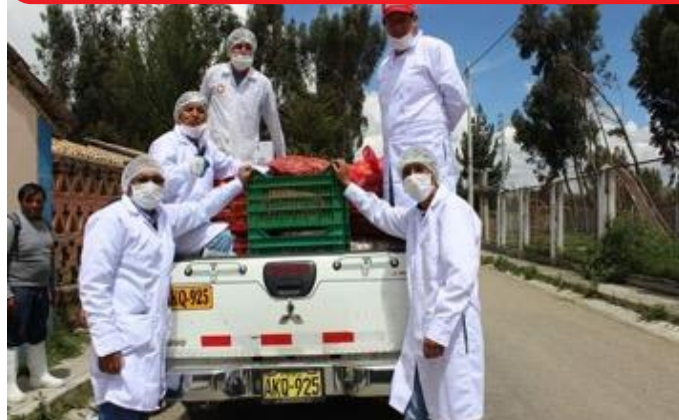
Cooperativa Inpami-Alimentando al Mundo (Masma, Jauja)