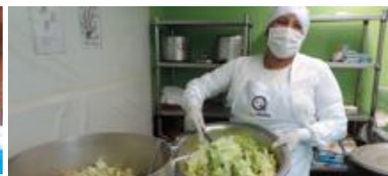
Capacitación al CAE