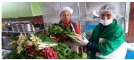
Escuela de Campo de Agricultores (ECA)