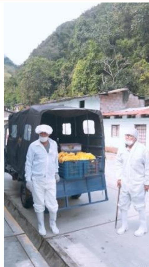
Asociación de Productores de Shincayacu (Vitoc)