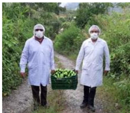
Asociación de Mariscal Castilla (San Luis de Shuaro)