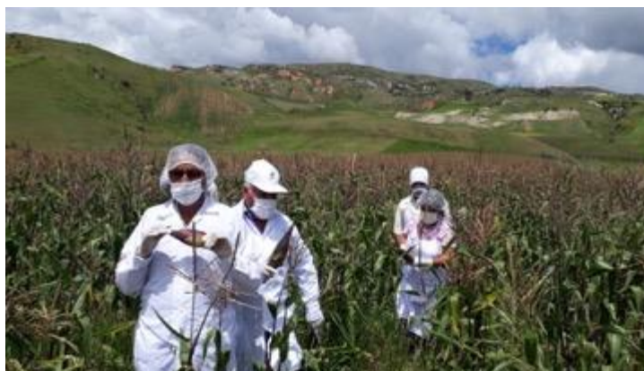
Maíz y mito (Concepción)