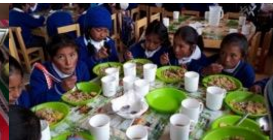
Pruebas de aceptabilidad