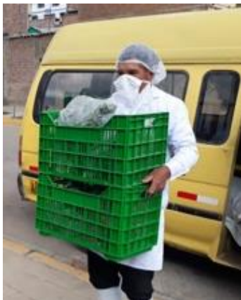
Asociación de Ayllu Kushisha (Pucará)